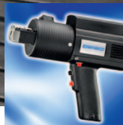
UV pistole (N*)